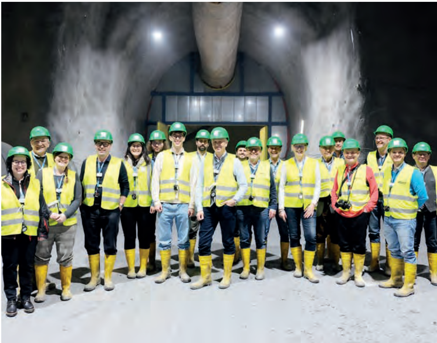
Unter Tag und trotzdem gut gelaunt: Bei der Besichtigung des BBT konnten die Teilnehmer die Fortschritte beim Baulos H53 Pfons-Brenner besichtigen.

Wie weit der Wiederaufbauprozess schon gediehen ist, war für viele der teilnehmenden Betriebe überraschend. Enge Kooperationen mit nationalen Institutionen – in Österreich die Kontrollbank AG (OeKB) – sollen die Risiken, die es für Investoren in einem Land im Kriegszustand gibt, minimieren. Die EU hat zudem ein Acht-Milliarden-Euro-Paket aufgestellt, das private Investoren in der Ukraine unterstützen soll; weitere Finanzmittel werden folgen. Doch Betriebe seien gut beraten, nicht erst auf diese Geldtöpfe zu warten, sondern bereits jetzt zu investieren und sich einen Startvorteil zu sichern.