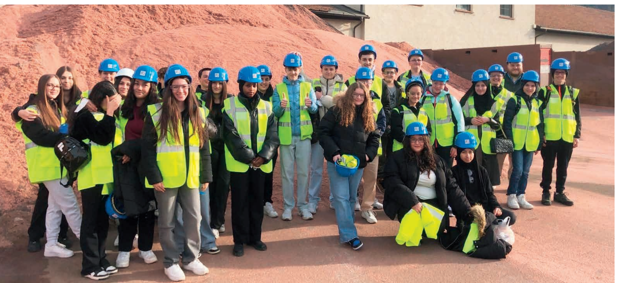
In Österreichs letzter Kupferhütte, den Montanwerken Brixlegg, wurde Schülern der NMS Wörgl gezeigt, wie das weltweit klimafreundlichste Kupfer erzeugt wird.

Der Next Generation Day 2024 war ein weiterer wichtiger Schritt, um das Bewusstsein für die Bedeutung der Industrie und von MINT-Fachkräften in Tirol zu schärfen. Die Initiative unterstrich noch einmal das Engagement der Tiroler Industriebetriebe und zeigte, wie sie Fachkräfte von morgen fördern und unterstützen. Motivierte und technikbegeisterte Talente sind die Basis für zukünftige Innovationen, die den Erfolg von Tirols Wirtschaftskraft und Wettbewerbsfähigkeit auch in den nächsten Jahrzehnten garantieren. Der Tag machte deutlich, dass die Förderung von MINT-Talenten eine wesentliche Investition in die Zukunft ist. Der Next Generation Day setzt damit ein klares Zeichen für die Bedeutung der MINT-Bildung in Tirol und ist ein wichtiger Impuls für eine erfolgreiche, innovative und nachhaltige Zukunft des Industriestandorts.