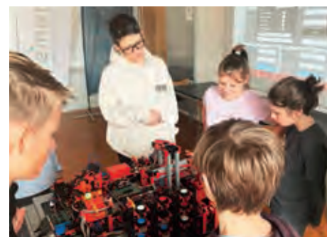
Beim Automatisierungsspezialisten ematric drehte sich alles um das Thema Robotik.

Die rege Beteiligung der Unternehmen und ihre spannenden Ideen, wie sie