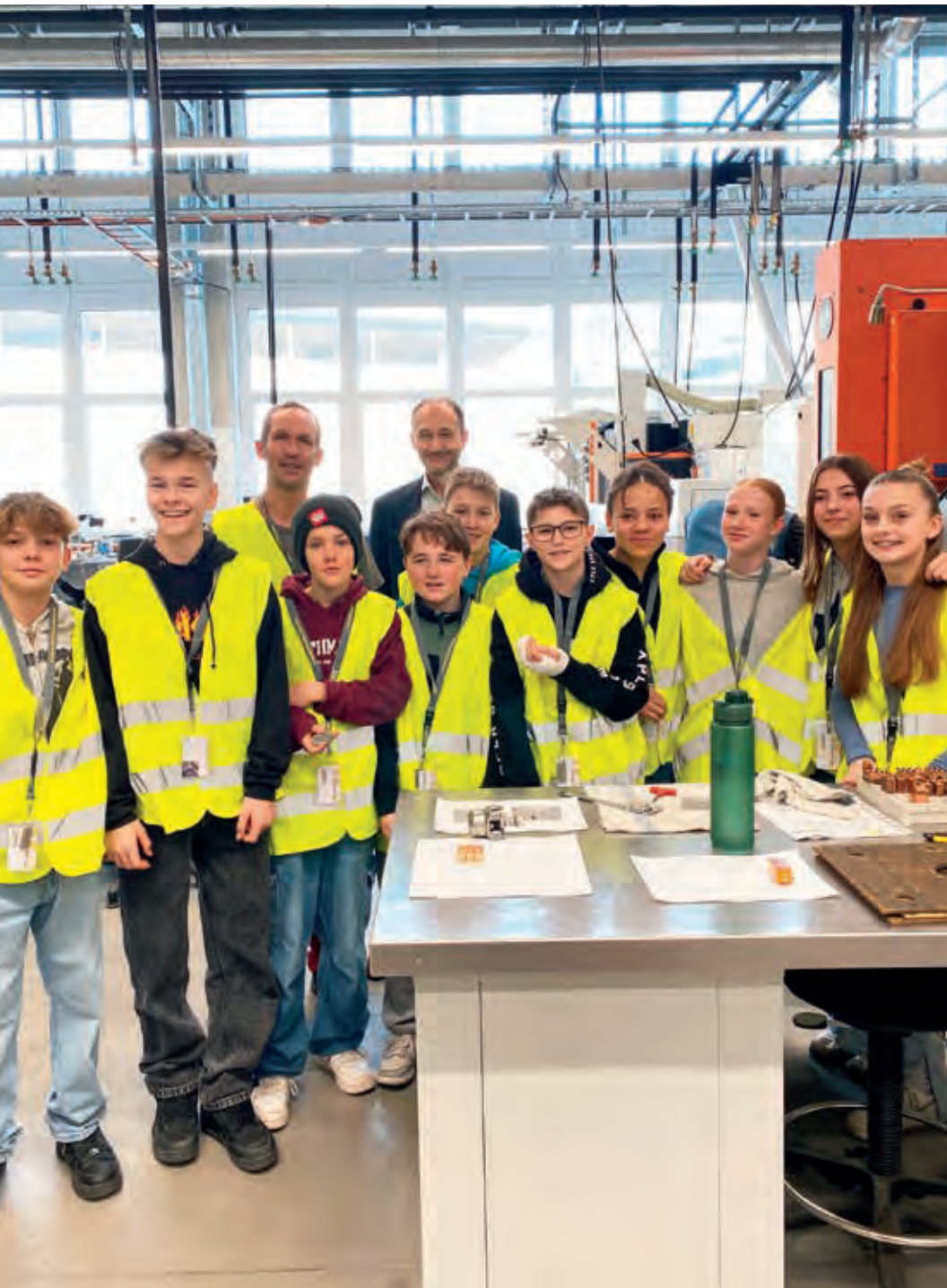
Schüler des Reithmann-Gymnasiums konnten bei Electro Terminal spannende Einblicke in die Produktion von elektronischen Verbindungselementen gewinnen.

Am 6. Februar 2024 öffneten Tiroler Industrieunternehmen im Rahmen des Next Generation Day ihre Tore für rund 400 technik- und wissenschaftsbegeisterte junge Menschen im Alter zwischen zehn und 14 Jahren.