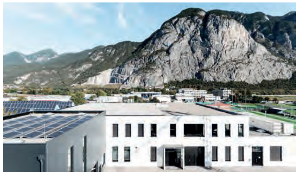
Das Kartenproduktionszentrum der exceet Card Group in Kematen/Tirol ist das modernste Europas.