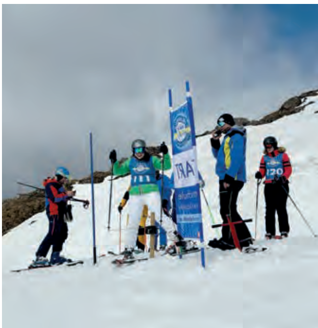
Widrige Wetterverhältnisse stellten die Teilnehmer dieses Jahr vor eine besondere Herausforderung.