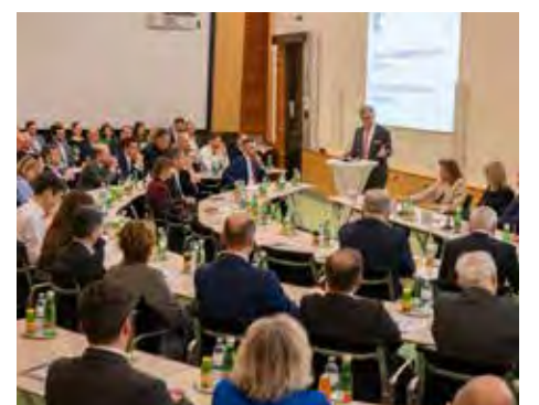
IV lud zum Austausch mit Magnus Brunner

zur Stärkung der österreichischen Exportwirtschaft ist. Regierung, Unternehmen, Länder und Europa müssten gemeinsam daran arbeiten, günstige Handelsbedingungen zu schaffen und den Zugang zu internationalen Märkten zu erleichtern.