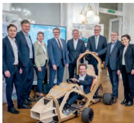
HTL-Leistungsschau im Haus der Industrie

Die Industriellenvereinigung ist Fürsprecherin der HTL als Standort-USP in Österreich. Nie war die Technischule wichtiger als heute: Ohne HTL-Talente gäbe es keine österreichische Industrie, wie wir sie kennen. Nicht umsonst hat die IV – neben der Unterstützung der Schulgründung in Moldau – in ihrem umfassenden Programm „Beste Bildung für Österreichs Zukunft“ für die HTL als einzigen Schultyp eigene konkrete Maßnahmen formuliert.