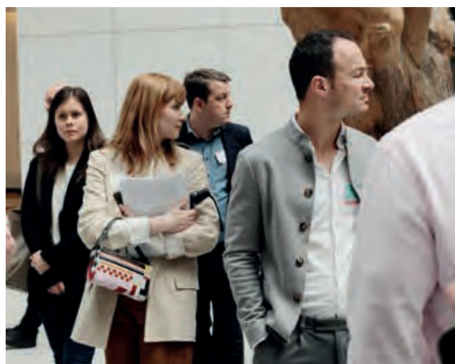
Die JI-Mitglieder bei der Besichtigung des EU-Parlaments.

Den krönenden Abschluss der Reise machte eine Hafentour in Antwerpen, bei der die JI-Mitglieder Containerschiffe beim Be- und Entladen bestaunen konnten.