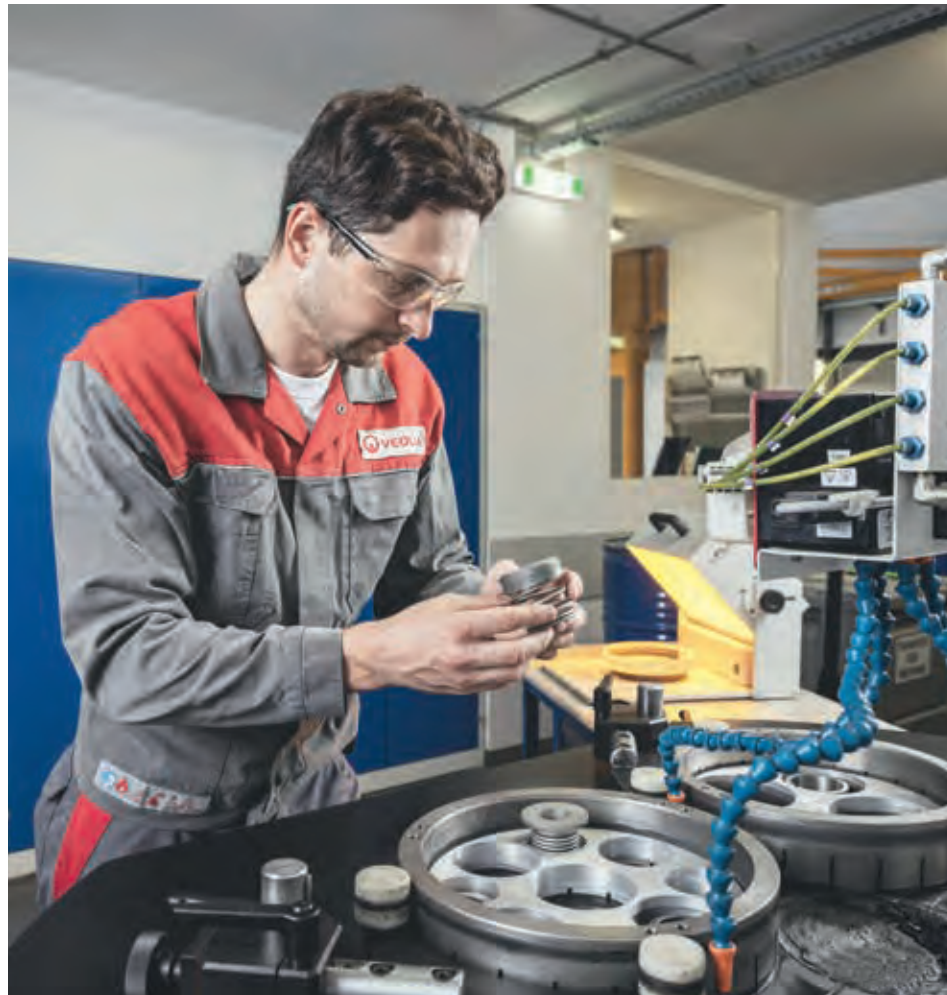
Präzise Industrie-Services durch Veolia.

Veolia übernimmt die Verantwortung für das ganzheitliche Management mit allen Medienströmen (z.B. Wasser, Energie, Abfall). Unser umfassendes Spektrum an Dienstleistungen für Betrieb & Maintenance von industriellen Versorgungseinrichtungen sowie unsere Asset-Management-Lösungen runden das Angebot ab. Dadurch ermöglichen wir es unseren Kunden, effizienter zu arbeiten und ihre Produktivität zu steigern. „Unser Ziel ist es, die