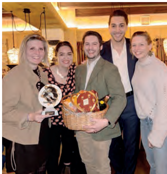
Die JI-NÖ/Bgld sicherte sich den Sieg beim traditionellen Skirennen.