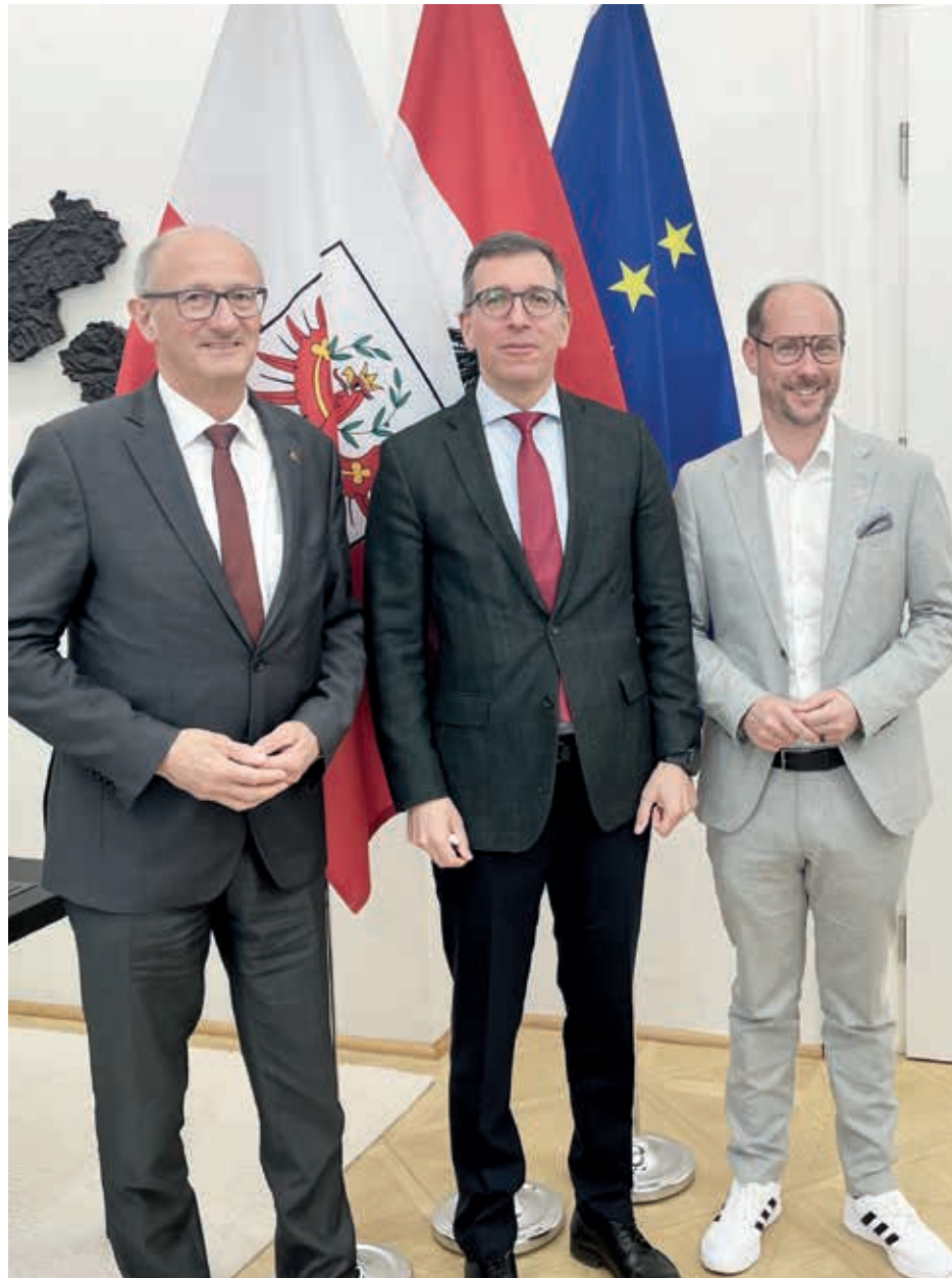
Entbürokratisierung und praktikable Lösungen für Tirols Mobilitäts Herausforderungen standen auf der Agenda des ersten Industriegesprächs 2024.

Ein weiteres Kernthema des Industriegesprächs war die Verbesserung der Anbindung Tirols an den internationalen Flugverkehr. Dies soll mittels der Wiederherstellung des direkten Flugverkehrs zwischen Innsbruck und dem Flughafen Frankfurt und der zeitlichen Optimierung der bestehenden Flüge zwischen Innsbruck und dem Flughafen Wien gelingen. Seit Anfang April gibt es keine direkten Flüge zwischen