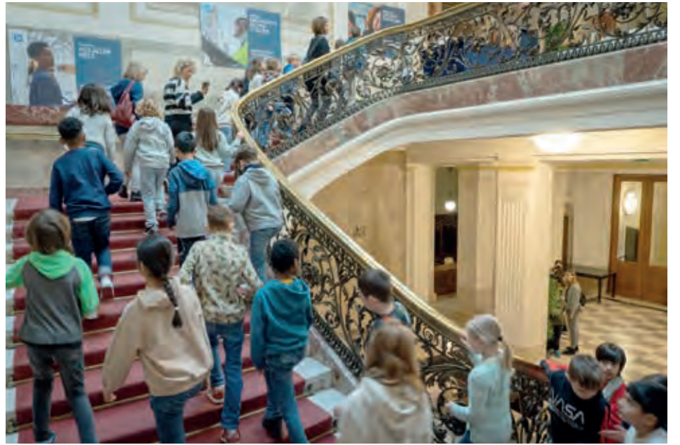
Schülerinnen und Schüler waren am Vorlesetag im Haus der Industrie zu Gast

Darüber hinaus beeinflusst das Vorlesen die kognitive Entwicklung. Laut einer Studie der American Academy of Pediatrics können Kinder durch regelmäßiges Vorlesen schon im Vorschulalter komplexe Strukturen und höhere Denkprozesse verstehen. Das stärkt ihre Konzentrationsfähigkeit und Kreativität. Aufgrund der vielen Vorteile des Vorlesens für die kognitive, sprachliche und emotionale Entwicklung und weil Lesen einfach Freude macht, unterstützt die IV den Vorlesetag nun schon das zweite Jahr. Neben unterhaltsamen Geschichten, u. a. aus MINTmausen mit Bakabu und einer Trockeneis-Show genossen die Volksschulkinder am 21. März im Haus der Industrie köstliche Erfrischungen.