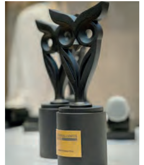
Die „Eule“ wurde zum ersten Mal vergeben