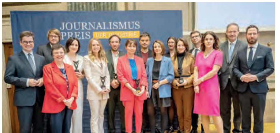
Die ersten Preisträgerinnen und Preisträger des Journalismuspreises der IV