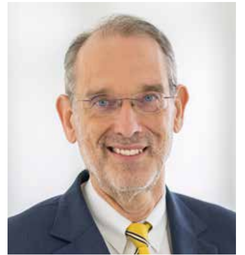
Heinz Faßmann ist Präsident der Österreichischen Akademie der Wissenschaften.

Heinz Faßmann ist seit 2022 Präsident der Österreichischen Akademie der Wissenschaften und spricht im Interview über die Rolle der Grundlagenforschung und Möglichkeiten, Forschung und Innovation in Österreich und Europa zu stärken.