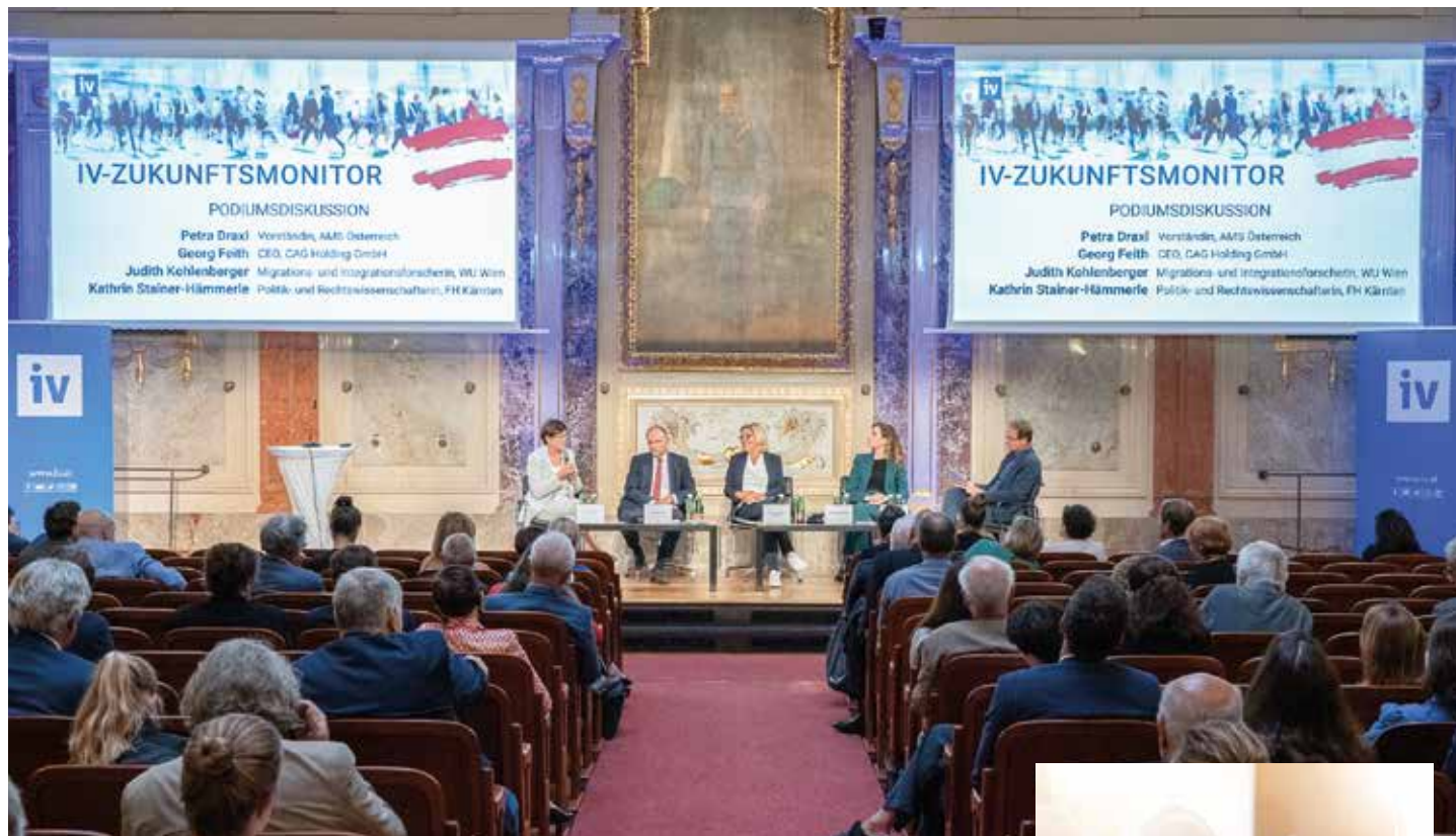
Der IV-Zukunftsmonitor wurde im Rahmen der Präsentation im Haus der Industrie von Experten diskutiert.