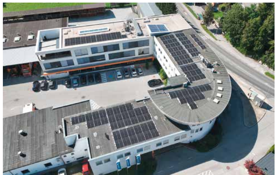
Nachhaltigkeit bei SWARCO zeigt sich u. a. in der Sonnenstromproduktion am Headquarter.