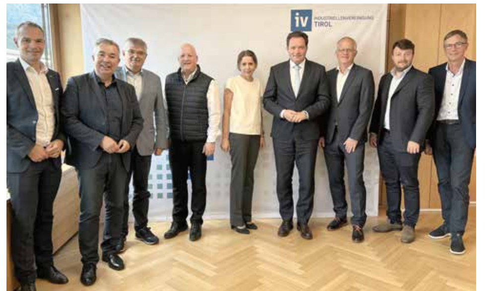
Die IV-Tirol-Unternehmerrunde ermöglichte einen spannenden Austausch zwischen Vertretern der Tiroler Industrie und Bundesminister Norbert Totschnig.

IV-Präsident Kloger schloss die Runde mit einem optimistischen Ausblick. Trotz der schwierigen Lage werde intensiv daran gearbeitet, die Weichen für eine erfolgreiche Zukunft zu stellen. Ziel sei es, die Standortattraktivität zu erhöhen und Investitionen zu erleichtern. „Jammern bringt uns nicht weiter“, sagte Kloger. Vielmehr gehe es darum, gemeinsam Lösungen zu finden, die eine nachhaltige wirtschaftliche Entwicklung fördern.