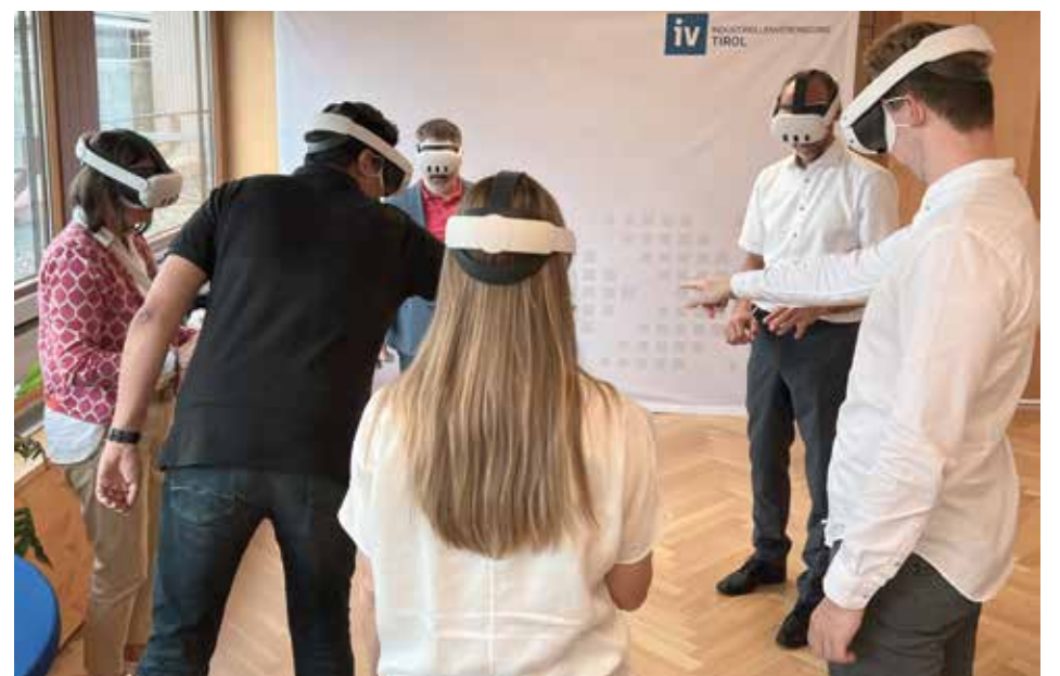
Dank der Anwendung „eXperience.together“ konnten Teilnehmer gemeinsam virtuelle Räume entdecken und in ihnen interagieren.

und waren begeistert von den Möglichkeiten, die XR für Marketing, Onboarding und Schulungen bietet. Besonders bei der Arbeit in internationalen Teams oder bei komplexen Projekten erweist sich XR als wertvolles Tool, um Inhalte visuell und interaktiv zu vermitteln.