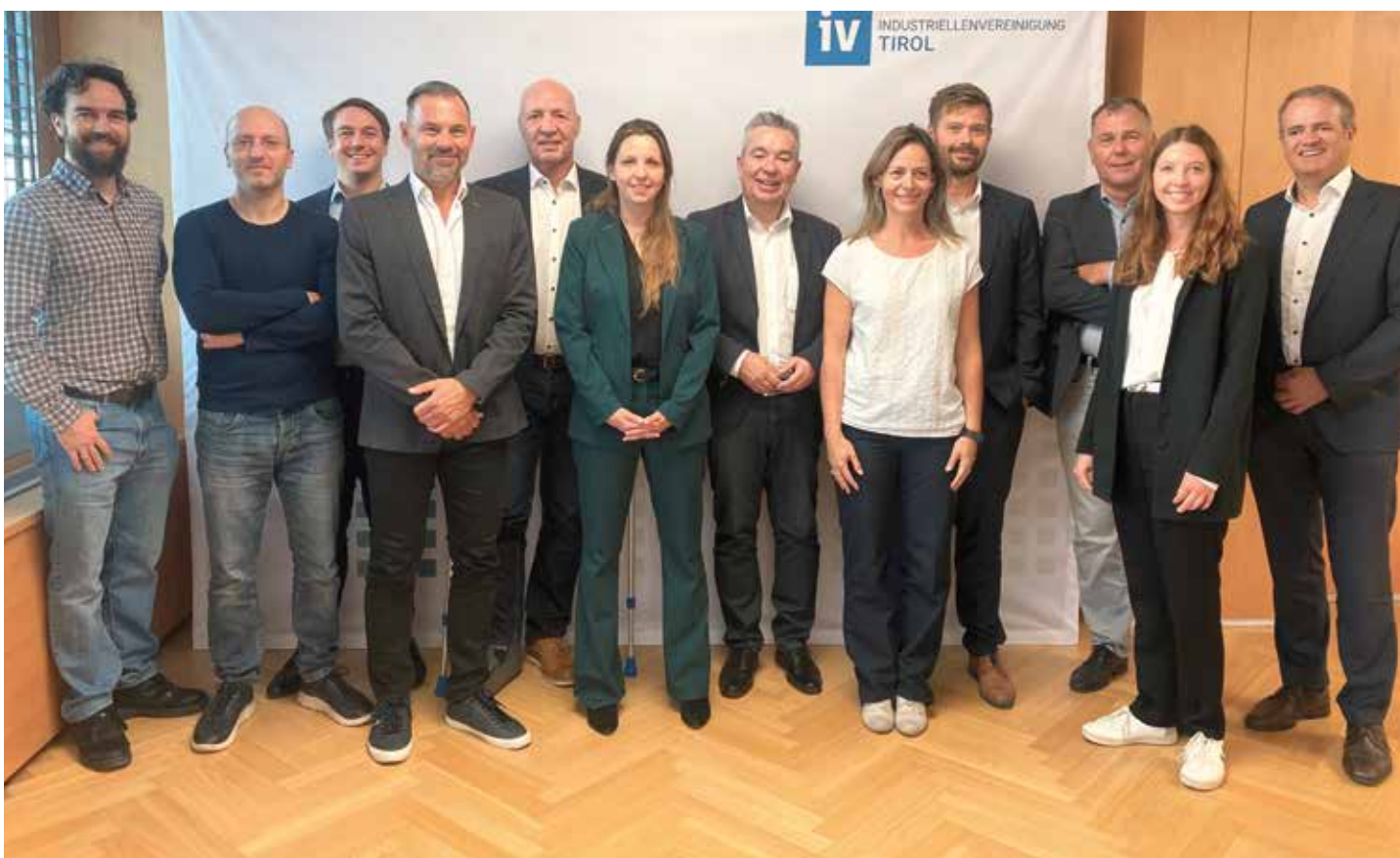
Die Präsentation von spannenden Use Cases aus der Tiroler Industrie zeigt, dass die Implementierung von KI-Projekten in Tirols Industriebetrieben schon voll im Gange ist.

Auch das 2. KI-Forum Tirol war ein großer Erfolg und hat erneut gezeigt, wie wichtig der Austausch zwischen den Betrieben und die Weitergabe von Wissen und Erfahrungen in diesem doch so jungen und rasch voranschreitenden Thema künstliche Intelligenz ist. Auf die positive Resonanz der Teilnehmer hin wird die IV Tirol das Format KI-Forum Tirol fortsetzen und freut sich bereits auf den nächsten spannenden Termin.