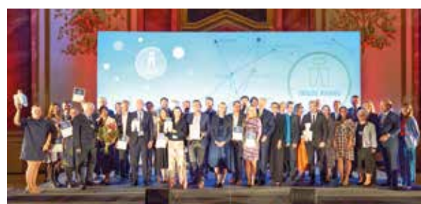
Im Rahmen der „TRIGOS Gala 2024“ zeichnete die Zivilgesellschaft Unternehmen aus, die sich durch besonders zukunftsfähiges und nachhaltiges Wirtschaften verdient gemacht haben.

„Klimaschutz“ finden sich viele IV-Unternehmen wie Infineon Technologies Austria, Greiner AG, Saubermacher Dienstleistungs AG, Raiffeisenlandesbank Burgenland und Revisionsverband eGen. Auch unter den Gewinnern sind die Mitglieder der Industriellenvereinigung gut vertreten: