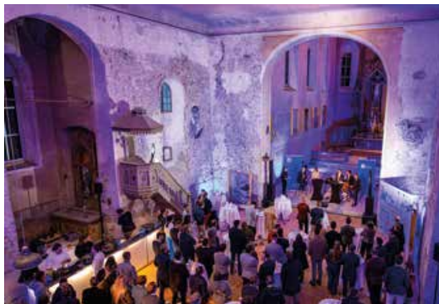
Eröffnungsabend in der Johanniterkirche.