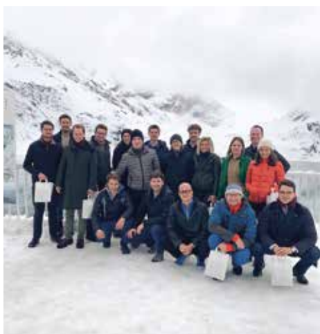
Der abschließende Ausflug zum Lünensee wurde von Schneefall begleitet.

Der zweite Tag der Bundestagung führte die Teilnehmerinnen und Teilnehmer zu spannenden Betriebs-