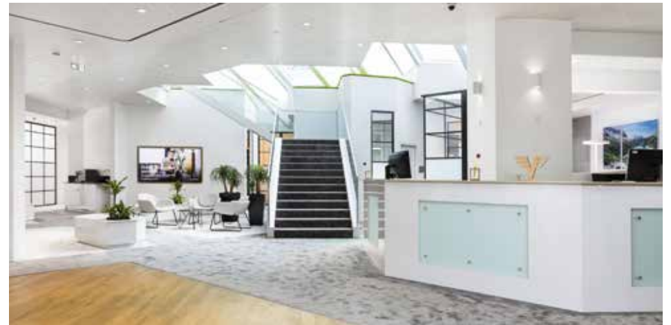
Seit der Renovierung der Hauptgeschäftsstelle in Innsbruck besticht das Bankfoyer durch sein helles und modernes Design.

Flexibles Arbeitszeitmodell zusammensetzt – und sheconomy und kununu kürten die Volksbank Tirol zuletzt zum „TOP FEMALE WORKPLACE 2024“.