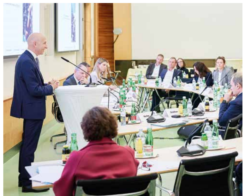
Wirtschaftsminister Kocher sprach über Entbürokratisierung.